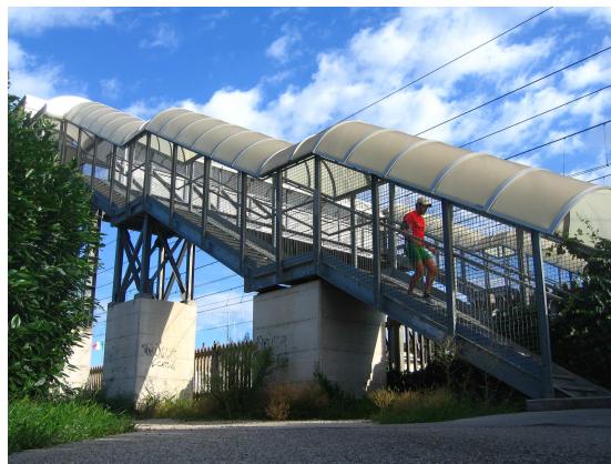
Foto 4 - Viadotto pedonale sulla direttrice ferroviaria Milano Venezia lungo Strada Paradiso a Bertessinella