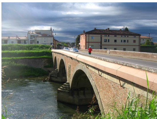
Foto 3 - Passaggio lungo il ponte Romano di Torri di Quartesolo lungo la SS 11