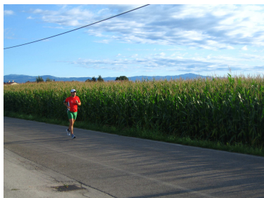
Foto 1— Via Altare la bellissima via di campagna che collega Marola a Lerino

• VIA ALTARE: IMMERSI NELLA CAMPAGNA Ci aspettano 3 km di pura gioia di correre immersi in una via di rara bellezza tra l'aperta campagna vicentina tappezzata da campi di mais con incastonate qua e là delle ville da sogno (Foto 1). La strada è stretta ma poco trafficata, sembra studiata appositamente per noi runners, presenta lunghi rettilinei alternati da divertenti tratti tortuosi. Continuiamo a seguire la strada avendo come riferimento il campanile della chiesetta di Lerino che a grandi passi si avvicina all'orizzonte. Al km 4 raggiungiamo il centro di Lerino, giriamo a destra attraversando il piazzale della Chiesa e concediamoci una sosta lungo un bellissimo viale pedonale alberato che presenta la prima fresca fontanella (Foto 2).