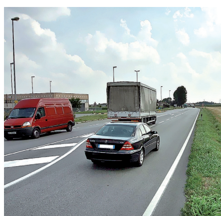
L'area lungo la Regionale 11 a Montebello interessata dal piano

Ora, quella superficie lungo la Regionale 11, nelle previsioni del piano adottato da poche settimane è un polo «plurifunzionale»: contempla il Cis, ma anche - potenzialmente - altre strutture. OPAG13